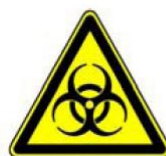
4.16. bioloģiskais rīks