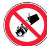
2.4. nedzēst ar ūdeni