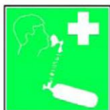
8.5. elpošanas līdzekļi