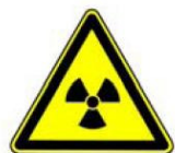
4.5. radioaktīvā viela vai jonizējošs starojums