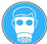
6.10. jālieto respirators