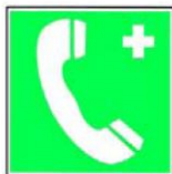
8.9. tālrunis neatliekamās medicīniskās palīdzības