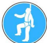
6.9. jālieto aizsargjosta