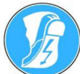
6.11. jālieto antistatiski apavi