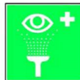
8.4. acu skalošana