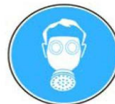
6.4. jālieto gāzmaska, respirators