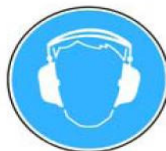
6.3. jālieto dzirdes aizsardzības līdzekļi