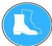
6.5. jālieto darba apavi