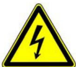
4.8. bīstami, elektrība