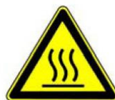
4.27. uzmanību, karsta virsma