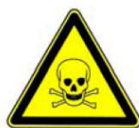
4.3. toksiska viela