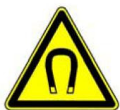
4.13. spēcīgs magnētiskais lauks