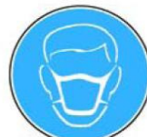
6.12. jālieto sejas maska