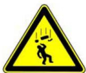
4.25. uzmanību, krītoši objekti