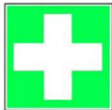
8.1. pirmās palīdzības punkts