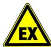
4.19. eksplozīva vide