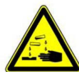
4.4. kodīga viela