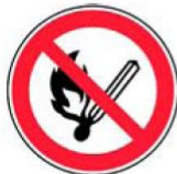
2.2. smēķēšana un atklāta liesma aizliegta