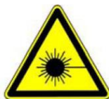
4.10. lāzera stars