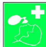
8.8. atdzīvinašanas līdzekļi