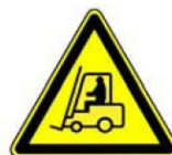
4.7. iekšējais transports