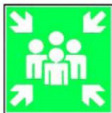
8.7. droša pulcēšanās vieta