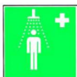
8.3. sanitārā apstrāde