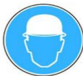
6.2. jālieto aizsargķivere