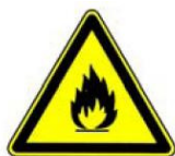
4.1. degoša viela vai ugunsbīstama telpa