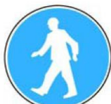
6.13. gājēju ceļš (maršruts)