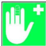
8.6. pārsiešanas līdzekļi