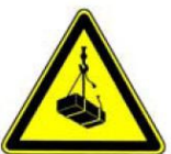
4.6. uzmanību, pacelta krava