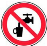
2.5. nav dzerams