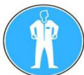
6.7. jālieto aizsargkostīms