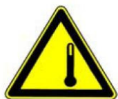
4.26. augsta temperatūra