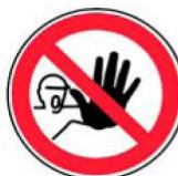
2.6. nepiederošām personām kustība aizliegta