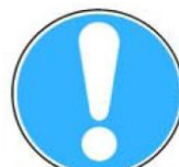
6.14. vispārīgā rikojuma zīme (lieto kopā ar citām zīmēm)