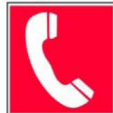
Tālrunis ugunsdzēsības un glābšanas dienesta izsaukšanai