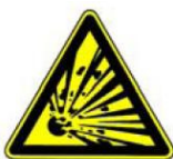
4.2. eksplozīva viela vai sprādzienbīstama telpa