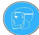
6.8. jālieto sejas aizsardzības līdzekļi