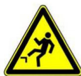
4.15. uzmanību, nelidzens