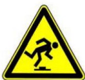
4.14. uzmanību, šķēršļi