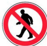
2.3. gājēju kustība aizliegta