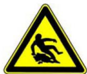
4.22. uzmanību, slidens