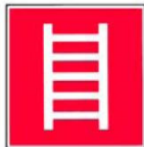
Ugunsdzēsības un glābšanas kāpnes