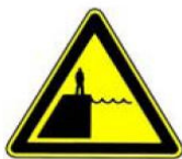
4.23. dziļš ūdens