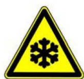
4.17. zema temperatūra