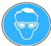
6.1. jālieto aizsargbrilles