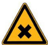
4.18. kaitīga vai kairinoša viela*