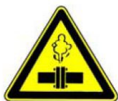
4.28. uzmanību, karsts tvaiks