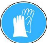
6.6. jālieto aizsargcimdi