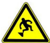
4.21. uzmanību, pakāpiens